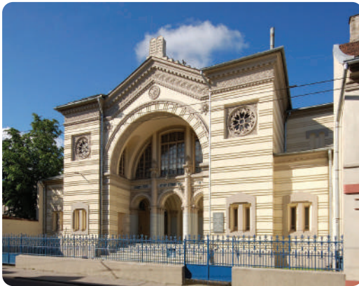
אַ שׁוּל אין שטאַט ווילנאַ

דִי הֶבְרָה האָבן זיך צאַמגערעדט אַוויפֿגעקומען מיט אַ פֿלאַן אַז דִי בעסטע צײַט צו קענען דוּרְכפֿירן דָעם אַקצײע, און קײנער זאַל נישט קענען האַלטן אַן אויג אויף זײ - אִיז נישט מער נישט ווייניגער, יום כּפּוּר בײַנאַכט!! אין דָעם נאַכט עפֿנט מען