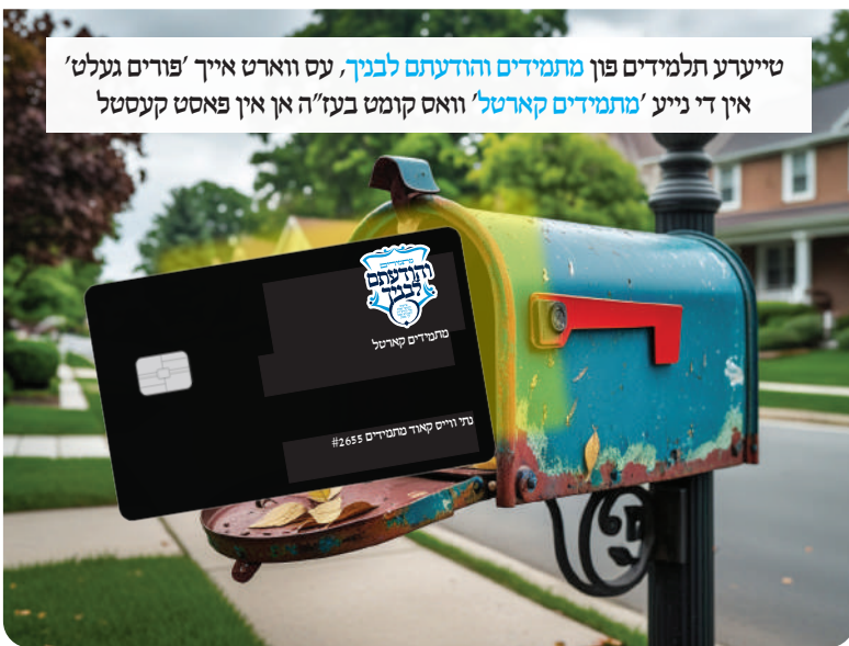
טייערע תלמידים פון מתמידים והודעתם לבנך, עס ווארט איך 'פורים געלט' אין די נייע 'מתמידים קארטל' וואס קומט בעז'ה אן אין פאסט קעסטל